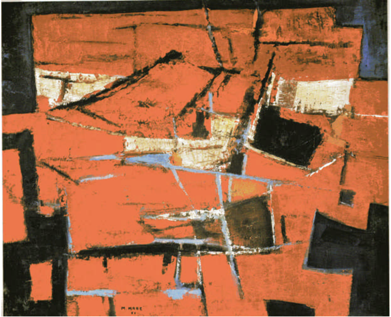
「Vibração Momentânea」 1955